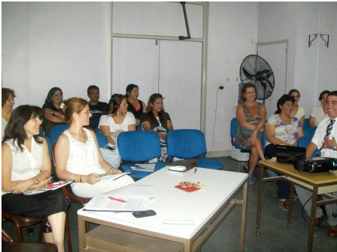
Docentes y alumnos de la carrera de Lic. Enfermería presenciaron las defensas de tesis